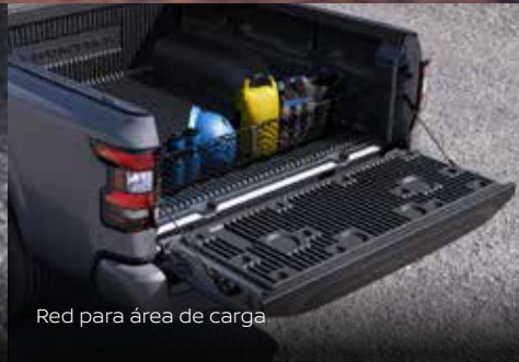
Red para área de carga