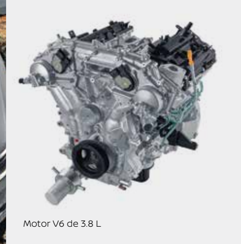
Motor V6 de 3.8 L