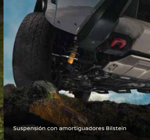
Suspensión con amortiguadores Bilstein