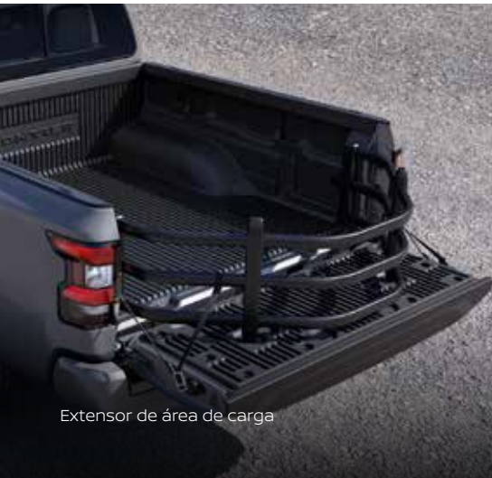
Extensor de área de carga

Personaliza tu Nueva Nissan Frontier V6 PRO-4X con los Accesorios Originales Nissan.