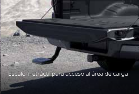
Escalón retráctil para acceso al área de carga