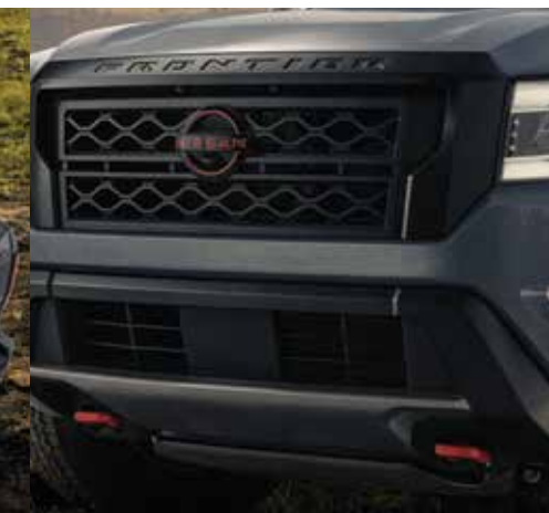
Ganchos de arrastre delanteros