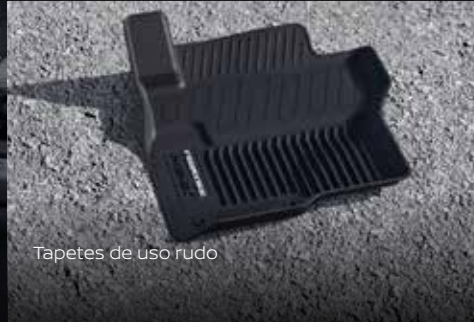
Tapetes de uso rudo