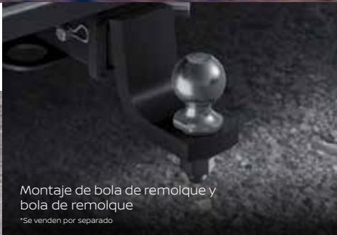
Montaje de bola de remolque y bola de remolque *Se venden por separado