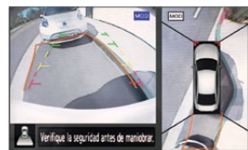
Vista trasera y cenital

Conéctate con tu auto como nunca habías podido, con las tecnologías de Nissan Intelligent Mobility. Nissan Altima® te permite controlar todo a tu alrededor mientras disfrutas la emoción de estar atrás del volante y sentir la confianza de tener una ayuda extra cuando tu conducción la requiera.