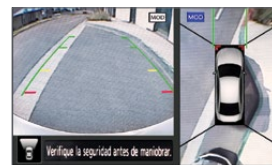
Vista frontal y cenital

INTELLIGENT AROUND VIEW MONITOR (Monitor Inteligente de Visión Periférica) Simula una vista aérea de 360° para que puedas tener una perspectiva de todo lo que te rodea, además el sistema de Detección de Objetos en Movimiento te alerta sobre obstáculos, peatones y objetos en movimiento, ayudándote a prevenir accidentes.